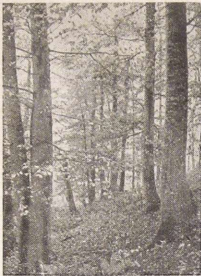
Слика на омоту: Део Резетвата »ПАПРАТСКИ ДО« на Фрушкој Гори