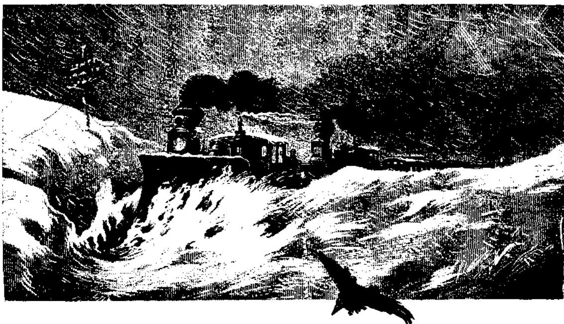
ZAMETI SNIEGA u GORSKOM KOTARU.