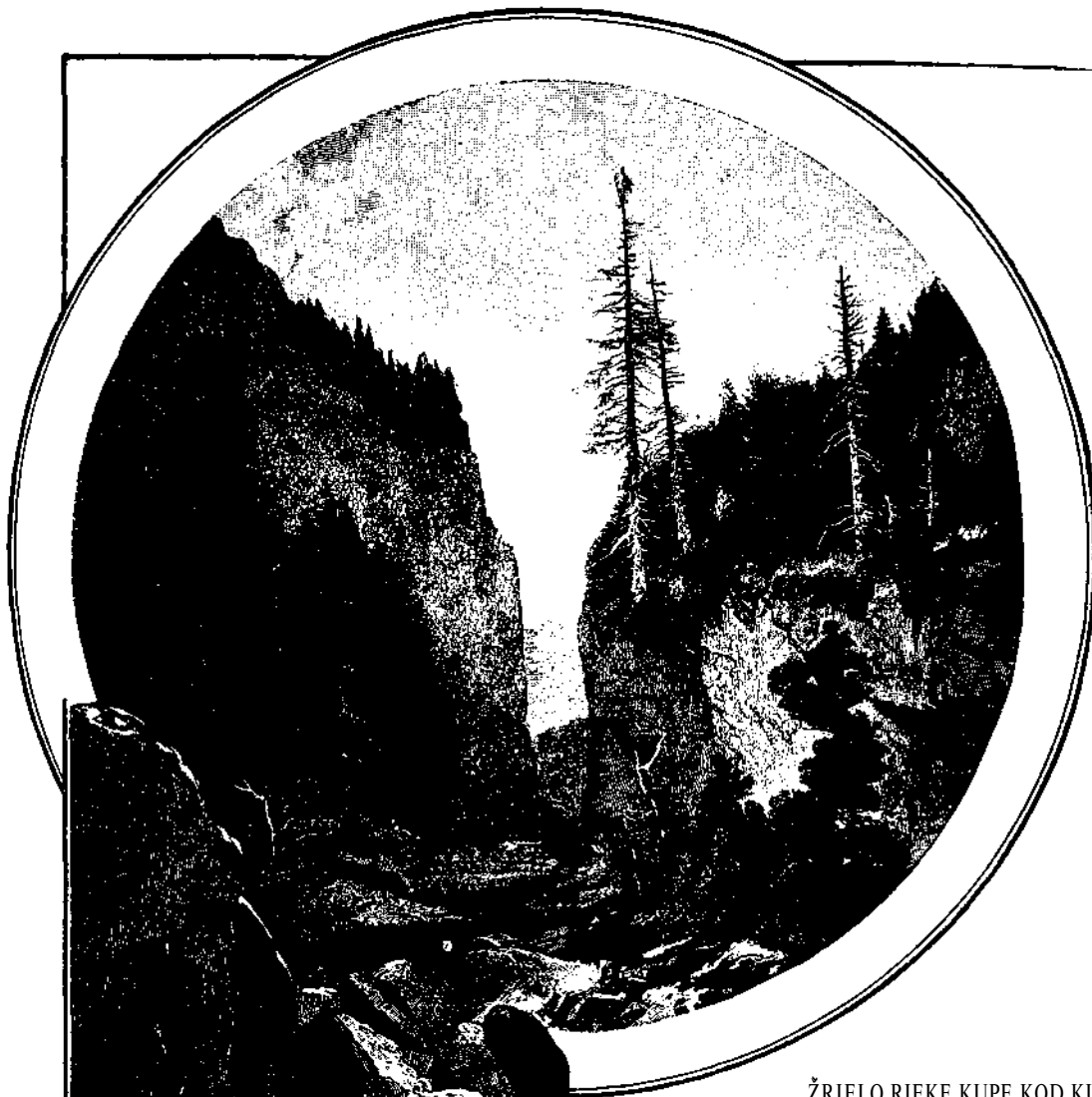
ŽRIELO RIEKE KUPE KOD KUŽELJA.