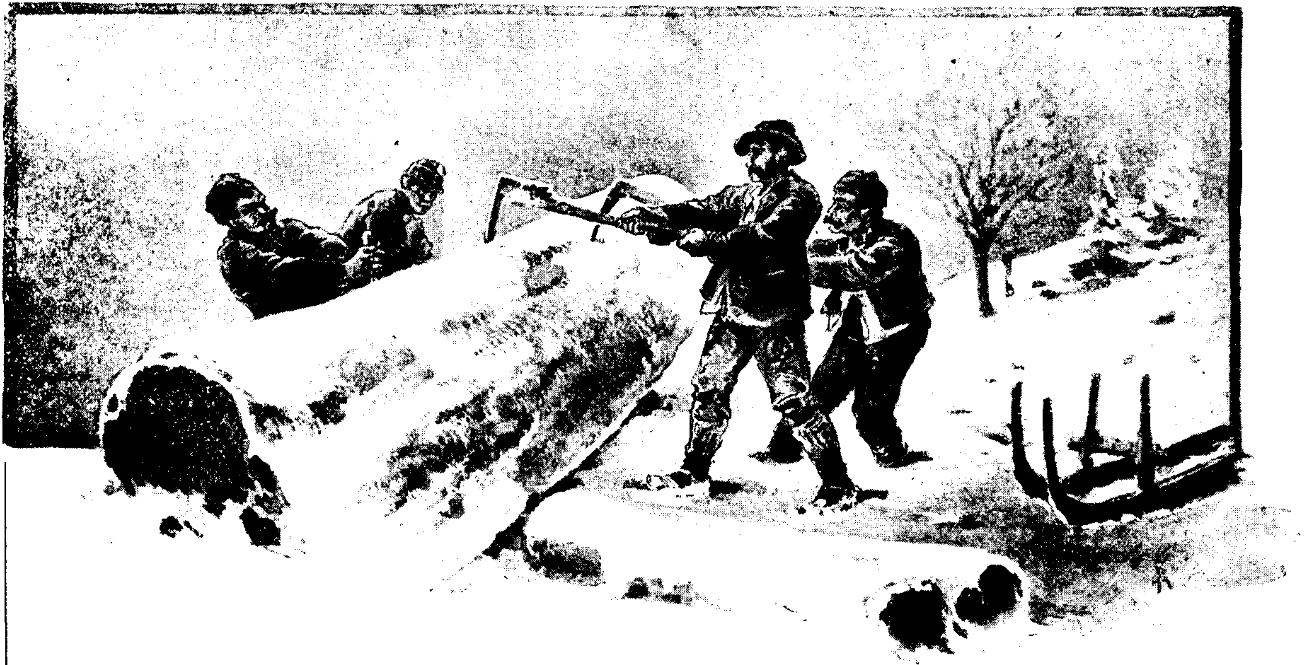
ŠUMSKI RADNICI U GORSKOM KOTARU.

Drugi rukav Ličanke ponire pod Kobiljakom u visini od 700 m. Medju dolomitnim stienama prva je rupa do 6 m duga, 1—2 m široka, a malo dalje je druga u dnu lievkasta i ilovasta. Odavle se korito suzi, puno je dovaljena kamenja, što odaje jakost vode. Tu prestaje Ličanka, a kad nije velika, tu uočiš i prvu vodu. Silne su opet