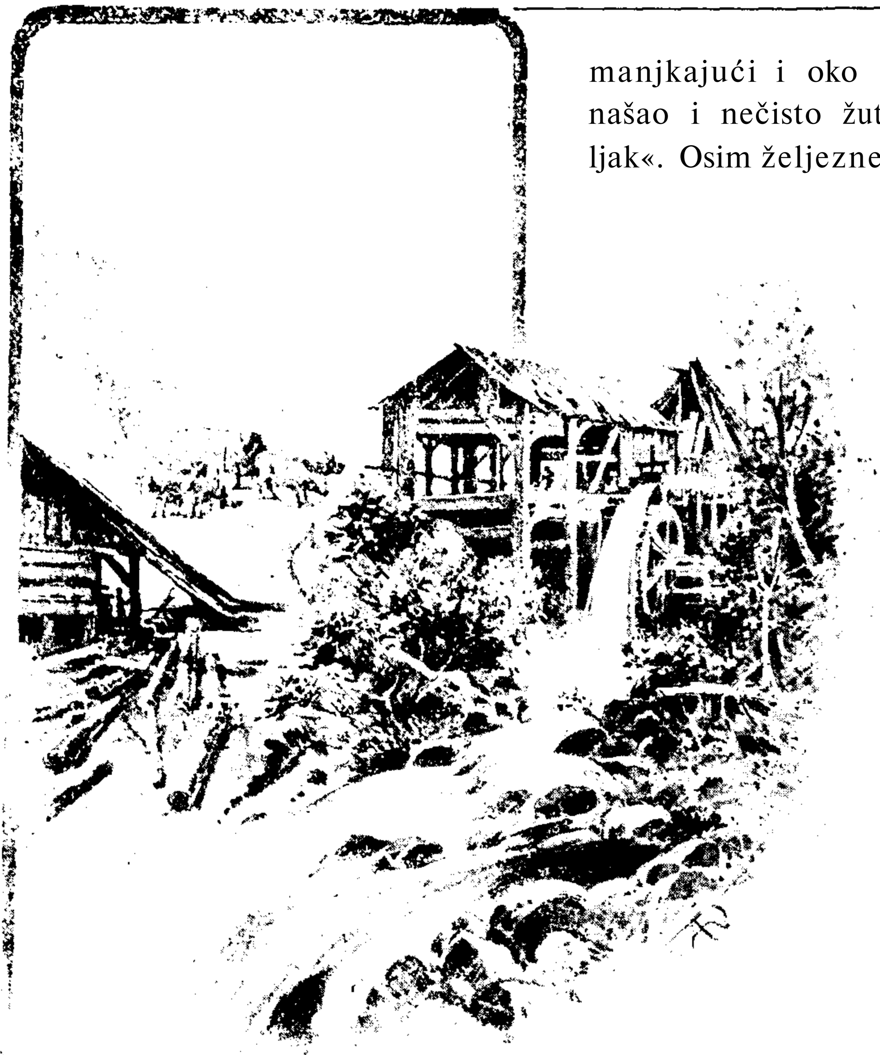
PILANA U GORSKOM KOTARU.

manjkajući i oko Fužine, gdje sam kod Benkovca našao i nečisto žuti pjeskar, koji ovdje zovu »žabljak«. Osim željezne rudače (hamatita) i gnjedca (limonita), ima i werfenskih škriljeva. Kako su slojevi mjestimice izprebacani, dalo se naslućivati, da ima oko Fužine i prolomnoga ili eruptivnoga kamena, pa je u istinu tako.