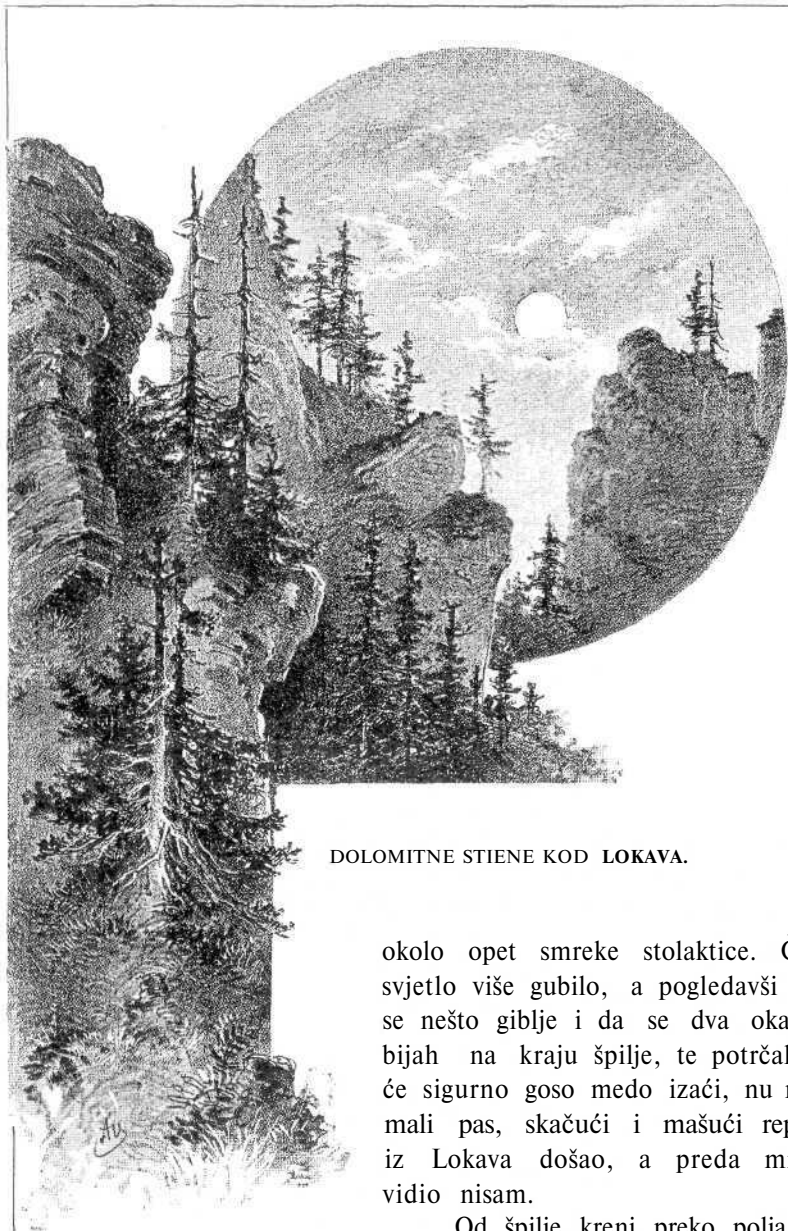
DOLOMITNE STIENE KOD LOKAVA.

njačama, zapleteni šikarom, grmljem, zakrčeni trulim smrekama, da se težkom mukom probiješ. Špilja je posve vidna i suha, sige u njoj nema, ali i malo života. Nad glavom mi prhnula jedna poveća sova, koju sam u njezinom skrovištu uznemirio bio. Kad si ovdje, nekako ti tiesno, čami ti prolaze tielom, te nehotice polaziš dalje. Nukamo? Opet u duboku kotlinu, kojoj se u zaledju nasadio dolomitni vrh. Sada okreni uz lieve stiene ove kotline, pak te opet zaustavi špilja, u kojoj se svjetlo za malo izgubi. Duga je 21 m, visoka 1 i po m, a na kraju 2 m široka. Pred ulazom postavio se veliki dolomitni balvan poput zida, a na