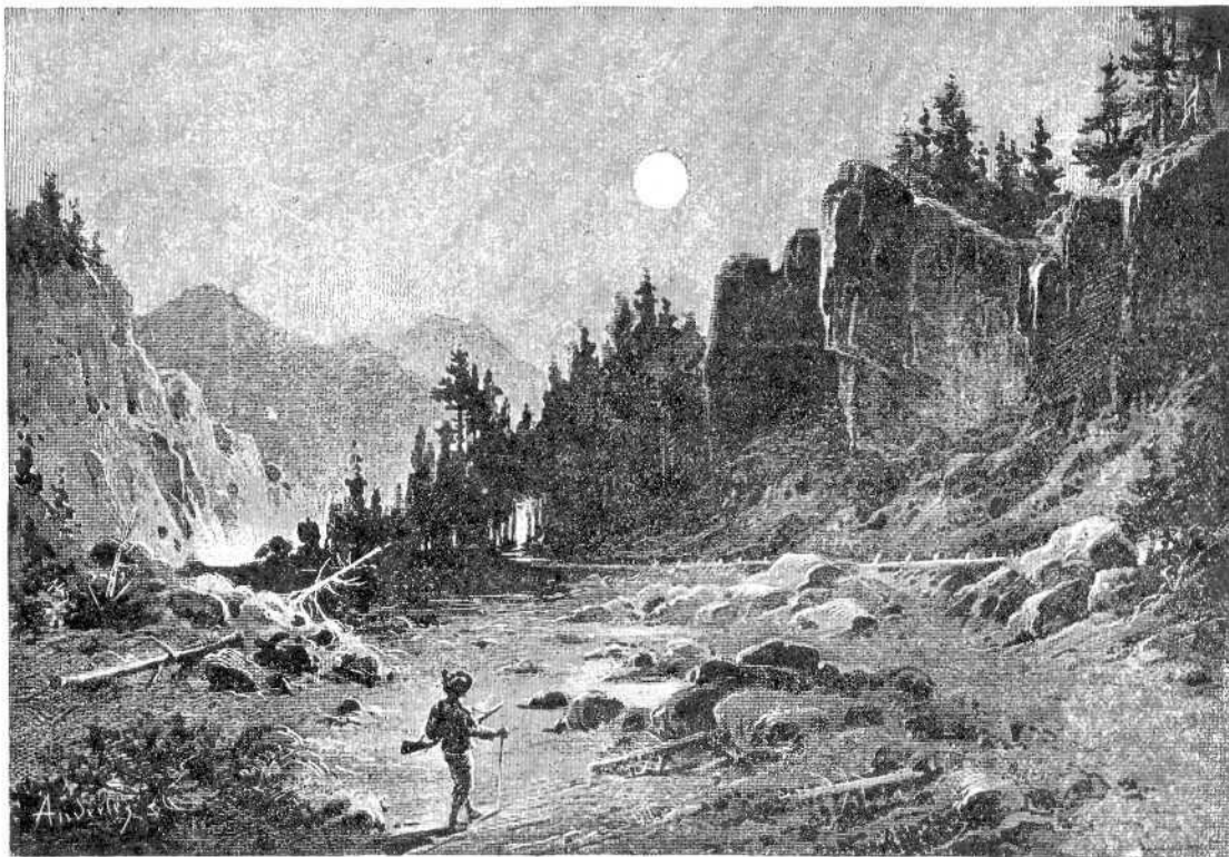
NA PUTU IZ LOKAVA U GEROVO.

Dne 14. kolovoza, poslie podne, spremismo se, da razgledamo spomenutu špilju. K nama se pridružiše na svom konjicu gg. P., Š. i još dva gospodičica, pak vodić, koji je uz posviet i ostale stvari nosio. Idući preko liepoga lokvarskoga polja, dodjosmo za četvrt sata u seoce Sljeme, koje leži pod istoimenim vrhom. Kroz vrh juri 320 m dugačkim prorovom željeznica prama Delnicama. Od ovdje do Bukovca trebasmo još četvrt sata, a tad skrenusmo, medju mrkim smrekama uzbrdice i dodjosmo pred špilju, koju Lokvarci »Velika pećina« zovu. Pred 3·8 m širokim i 1·6 m visokim ulazom uzpinju se silne pećine, a po njima vite smreke i jele. Tu posjedasmo, da malo odahnemo, a tad se zaputismo 54 m dugačkim hodnikom, u koji svjetlo na daleko prodire. Na kraju mu se otvara dvorana 10 m široka i polukružna svoda. Sigastih prilika ne ima u njoj, niti nadjosmo tekuću vodu, koja bi dosta jaka bila, da stvori pred ulazom