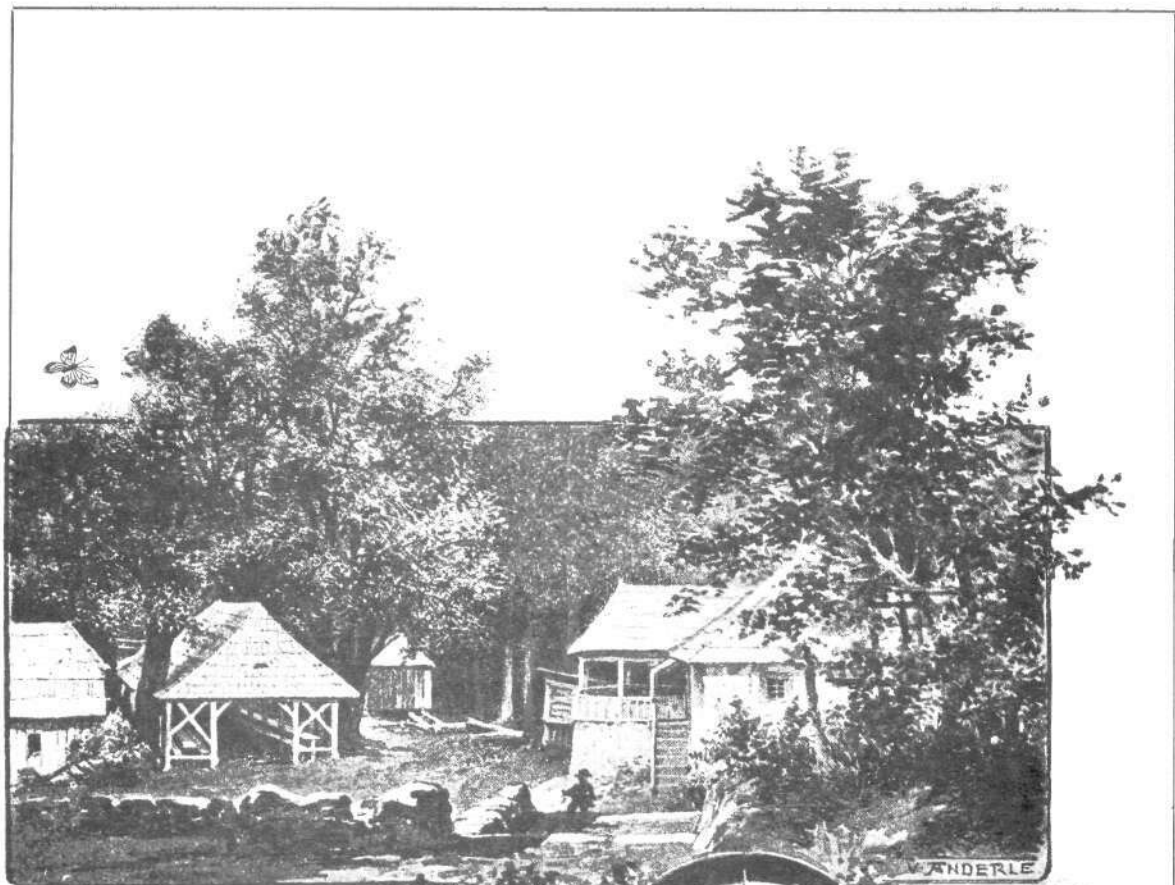
SAJMIŠTE I CRKVA NA SV. GORI.