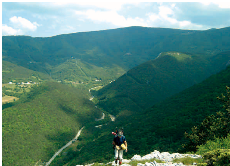
Iznad zelene Senjske drage

Svima koji žele upoznati nešto novo predlažem da s ovog mjesta, s Vratnika, krenu nizbrdo pješice u Senj te na taj način upoznaju upravo ta djela i posebno Kaudersov put. Profesor Alfons Kauders (Zagreb, 1878. - 1966.) bio je šumarski stručnjak i pisac, tek posljednji od velikog broja šumara koji su svoj rad utkali u ovo zelenilo, a za nas planinare značajan je kao graditelj vrlo zanimljive građene staze, koja se iz samog grada Senja uzdiže do Rončević dolaca.