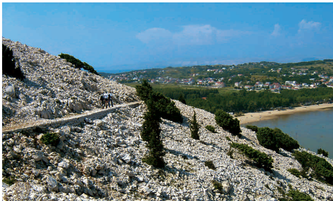
Premužičevo djelo na otoku Rabu