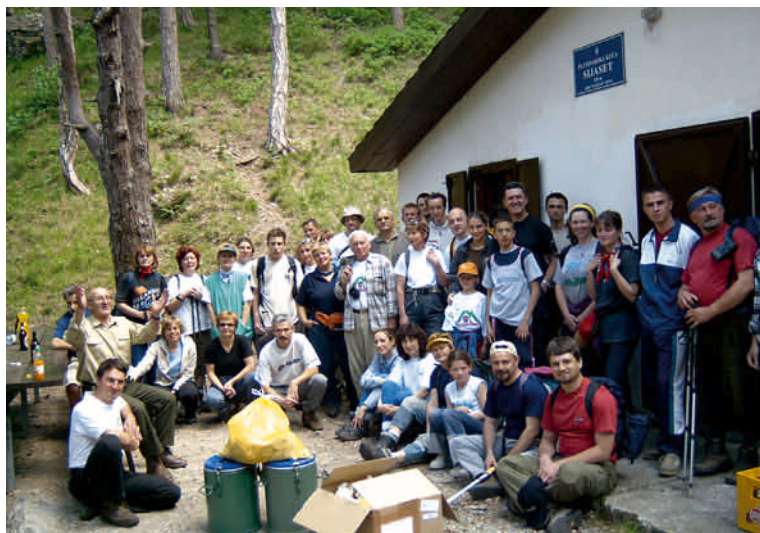
Pred planinarskom kućom »Sijaset« u Sijasetskoj dragi

Šumarija Senj nedavno je dobro prokrčila stazu, a PD »Šumar« je, uz tek nekoliko mačeta i