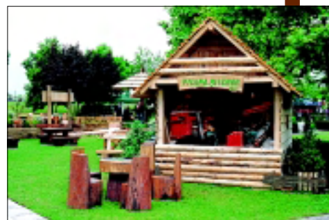
S Floraarta 2004.

da Zagreba. Ovogodišnju priredbu koja je okupila čak 180 izlagača koji su Zagrepčanima i mnogim posjetiteljima pokazali svoju vještinu oblikovanja cvijeća i prostora, otvorio je predsjednik Republike Hrvatske Stjepan Mesić.