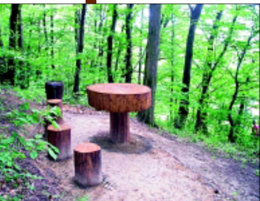
Odmorište uz put