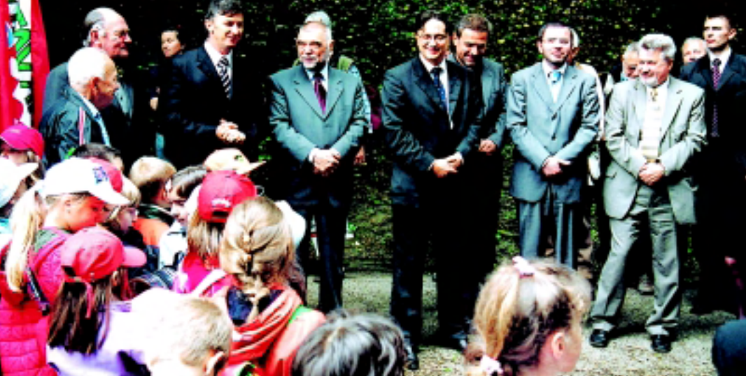
Sa svečanog otvaranje planinarske staze