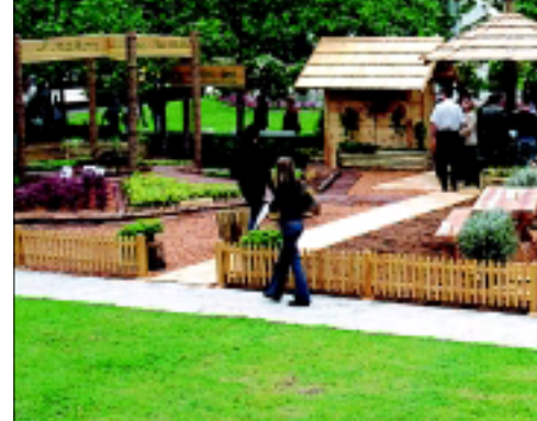
Ove godine pod motom »I poslije šume, šu

H rvatske šume primjereno su se predstavile na 39. međunarodnoj vrtnoj izložbi cvijeća Floraart 2004. koja je u Zagrebu održana od 2. do 6. lipnja. Nagradene su Zlatnim stručkom za kreativni izraz u prostoru te nagradom Turističke zajednice gra-