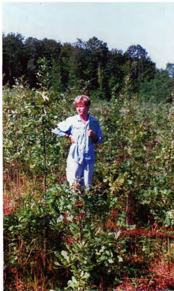
Sl. 2: Pet-godišnja kultura hrasta lužnjaka sa 7000 biljaka po ha i razmakom sadnje 1,2 \times 1,2 \text{ m} .

Fig. 1: Peduncled oak culture, age 5, established with 3000 plants per ha, planting distance 1,8 \times 1,8 \text{ m} .