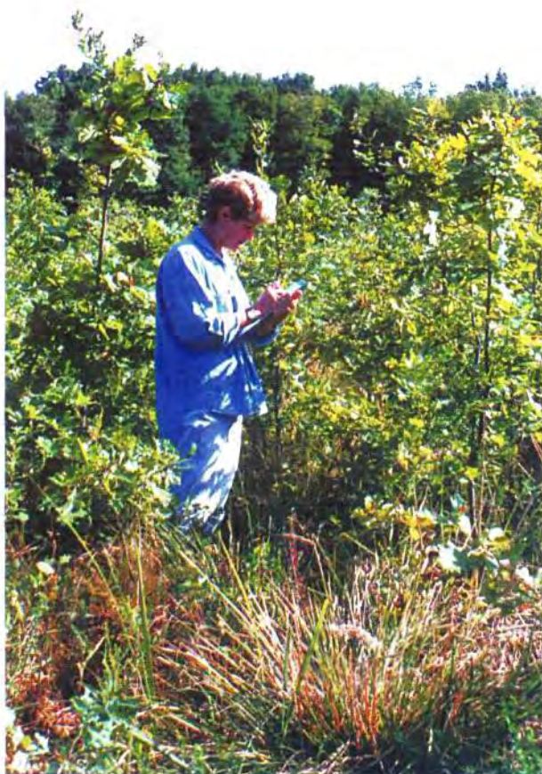
Sl. 3: Pet-godišnja kultura hrasta lužnjaka s 15000 biljaka po ha i razmakom sadnje 0,8 x 0,8 m.