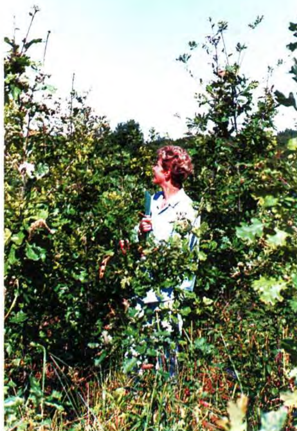
Sl. 4: Pet-godišnja kultura hrasta lužnjaka s 20000 biljaka po ha i razmakom sadnje 0,7 x 0,7 m.