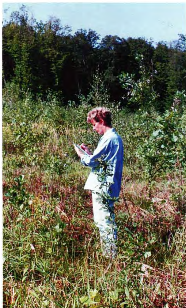
Sl. 1: Pet-godišnja kultura hrasta lužnjaka s 3000 biljaka po ha i razmakom sadnje 1,8 \times 1,8 \text{ m} .

Kod njegovanja kultura tijekom 5 godina trošilo se različito vrijeme po biljci ovisno o razmaku sadnje. Kod 3000 biljaka/ha vrijeme utrošeno za njegu (žetva korova) po jednoj biljci iznosilo je 2' 44", a kod sadnje 20000 biljaka/ha 0' 33".