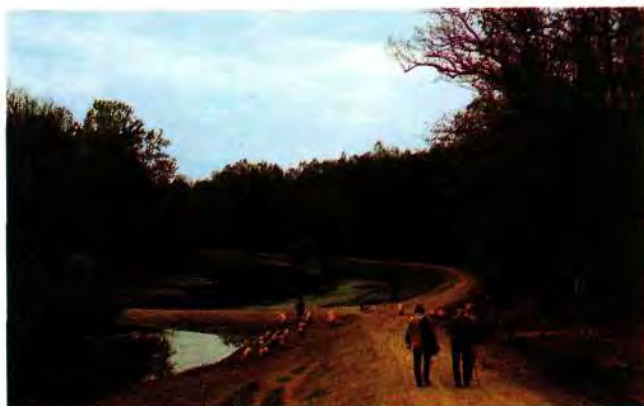
Šumski, slatkovodni i poljoprivredni ekosustav srednjeg Posavlja. Wald,- Acker,- und Süßwasserökosystem in Sava-Ebene.

Usporedbom podataka o količinama Pb u poljoprivrednim i šumskim tlima, ustanovili smo da postoji