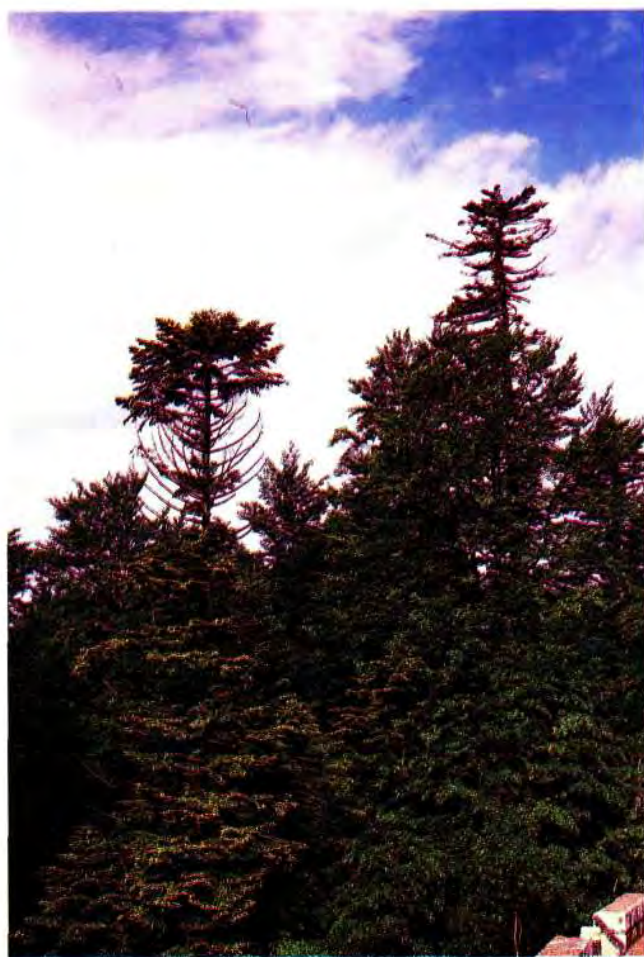
Sušenje jele u Gorskom kotaru je indikator zakiseljenosti šumskih i poljoprivrednih tala. Tannensterben in Gorski Kotar – Indikator der Wald,- und Acker-bodenversauerung.