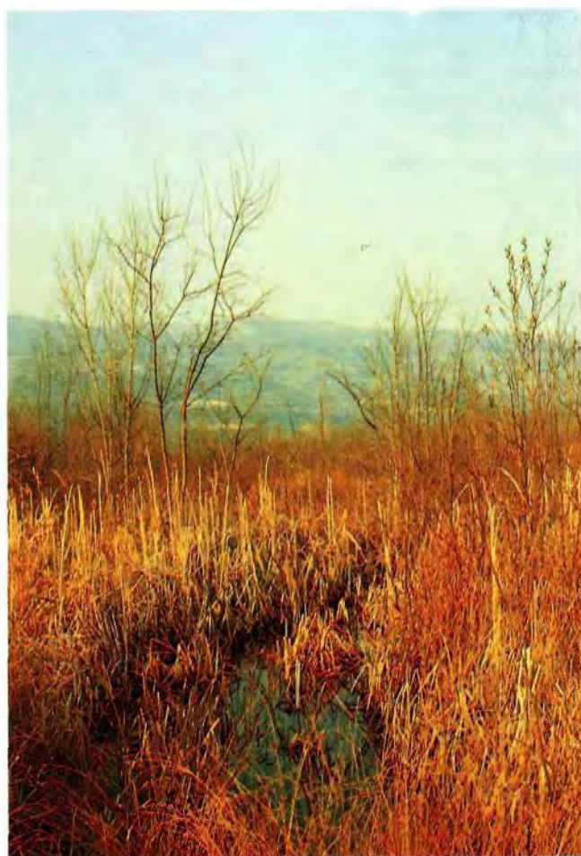
Neuspjeli pokušaj pretvaranje nizinske šume u oranicu. Zamočvarenje tla poslije sječe Motovunske šume u Istri. Versumpfung nach Kahlschlag im Motovunwald (Istrien). Erfolgleses Verwandeln Wald in Acker.