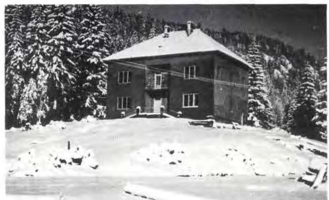
Sl. 5. Upravna zgrada građena 1939. god.