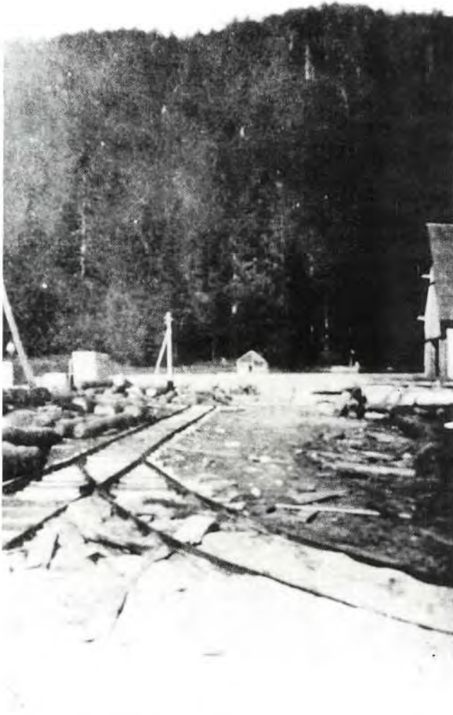
Sl. 2. Stovarište oblovine s vrelom »Kučerak« u pozadini.

Pilanska se proizvodnja svodi na rad 6 do 7 mjeseci. U 1939. godini forsirano je produženje, koje je trajalo sve do 15. prosinca, ali s umanjenim učinkom, jer je od početka studenoga do tada izgubljeno 10 dana uslijed sniježnih vijavica. Radom u dvije smjene godišnje se prerađuje oko 8000 kubika oblovine. Građa je pretežno usmjerena na talijansko tržište. Radnici su pretežno iz pazariškog kraja. Stanovali su na Štirovači. Su-