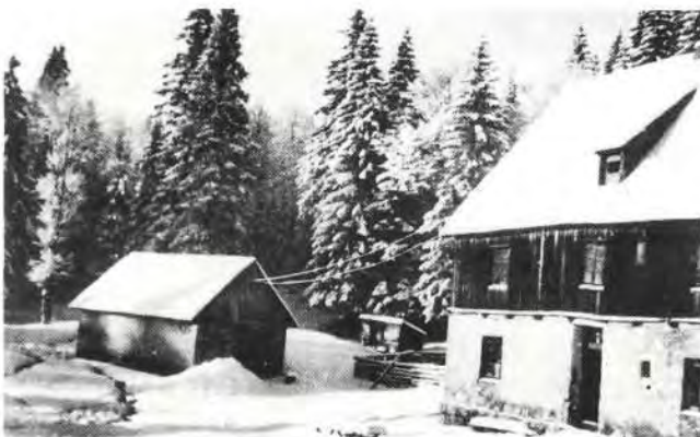
Sl. 4. Zgrada pod nazivom »kantina« — trgovina, gostionica i postrorije zakupaca pilane.

Iz ovoga proizlazi da naziv Štirovača vuče korjen od imena biljke štir, kasnije preimenovane u lobodu, koja u spomenutoj knjizi predstavlja biljku 15 do 60 cm visine s bujnim rastom po humusnom tlu viših položaja Velebita, osobito oko pastirskih stanova.