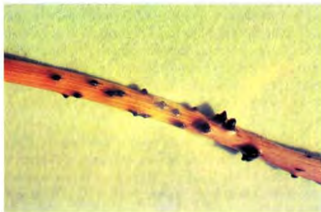
Sl. 3. Pikvide Sphaeropsis sapinea na oboljeloj iglici crnog bora Fig. 3. Sphaeropsis sapinea pycnidia on infected Austrian pine needle.