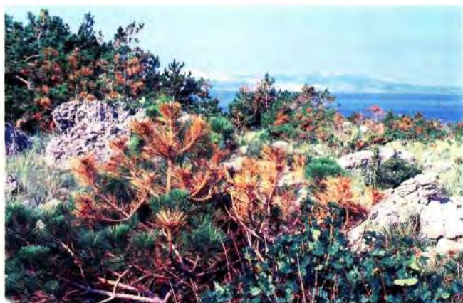
Sl. 2. Oboljeli borovi u kulturi Klenovica Fig. 2. Injured pines in the Klenovica plantation (Foto-Photo D. Diminić).

Gljiva Sphaeropsis sapinea (Fr.) Dyko et Sutton uzrokuje klorozu i nekrozu ovogodišnjih iglica, nekrozu izbojaka i grana, rak debla, prstenastu trulež, bolest korije-