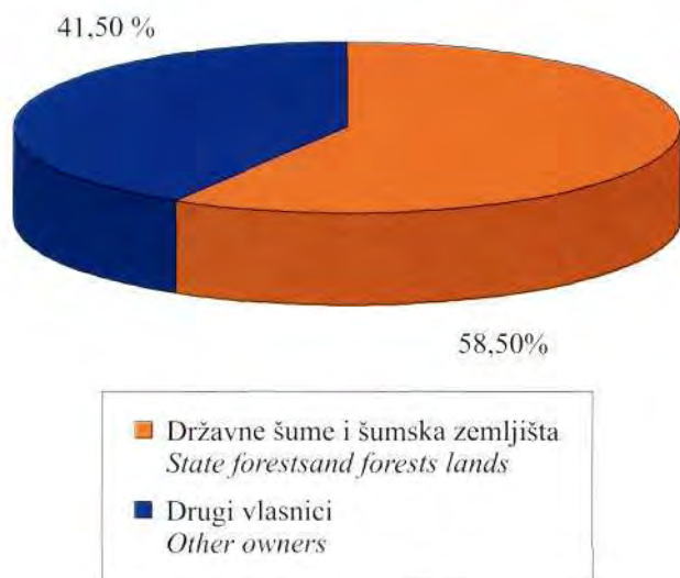
Grafikon 1. Prikaz postotnih vrijednosti zastupljenosti opožarenih površina u državnom vlasništvu, te drugih vlasnika.

Graph 1 The survey of percentage of the share of areas affected by fires owned by the state and other owners