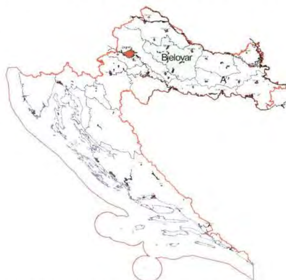
Slika 1. Zemljopisni položaj objekta istraživanja Figure 1 Geographical location of research object

šumarstvo. U Hrvatskoj su kasnije bili zastupljeni već navedeni Timberjack 208 D, Timberjack 225 D i Tim-