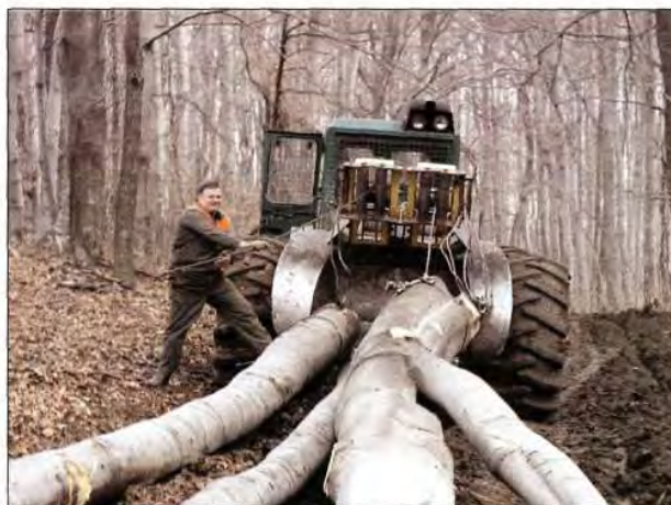
Slika 2. Privlačenje oblovine traktorom Timberjack 240 C Figure 2 Roundwood skidding by tractor Timberjack 240C

Prema zadnjim podacima "Hrvatske šume" p. o. Zagreb su u razdoblju od 1999. do 2001. kupile 45 traktora Timberjack 240 C. Godine 1999. je kupljeno 27 traktora, od kojih je 12 opremljeno dvobubanjnim vitlom Adler HY16, a 15 traktora jednobubanjnim vitlom T40 D. Tijekom 2000. i 2001. godine kupljeno je 6, odnosno 12 traktora, svi s vitlima Adler HY16. Na taj je način, uz kupnju forvardera Timberjack 1210, 1410 i 1710 i Valmet 860 te drugih traktora (Steyr, Valmet) obnovljen strojni park za privlačenje i izvoženje drva u Hrvatskoj. Budući da je traktor Timberjack značajno zastupljen u šumarstvu Hrvatske potrebno bi bilo provesti istraživanje na većem broju radilišta različitih uvjeta.