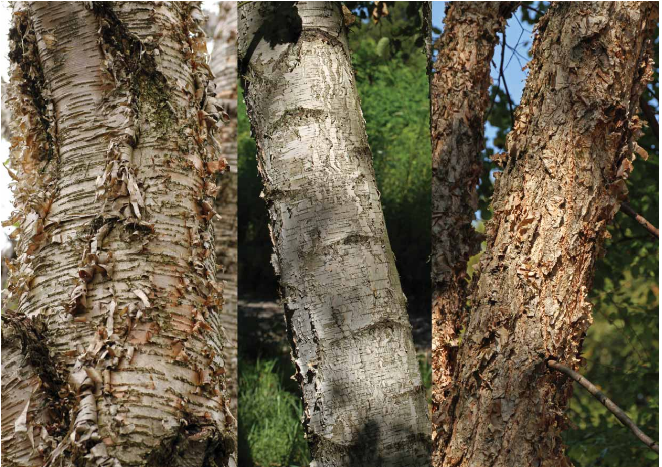
Slika 7. Žuta breza ( Betula alleghaniensis ), bijela breza ( B. papyrifera ) i mrka breza ( B. nigra ) Figure 7 Yellow birch ( Betula alleghaniensis ), paper birch ( B. papyrifera ) and black birch ( B. nigra )

za oporavak. Međutim, mora se računati s mogućnošću da svi neće uspjeti opstati i da će neke naknadno trebati ukloniti te zmijeniti novima.