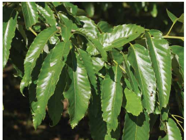
Slika 8. Kineski hrast plutnjak ( Quercus variabilis ) Figure 8 Chinese cork oak ( Quercus variabilis )

(L.) Mill., Ostrya virginiana (Mill.) K. Koch (virdžinijski crni grab), Pyrus betulifolia Bunge (brezolisna kruška), Quercus dentata Thunb. (japanski carski hrast), Q. imbricaria Michx. (lovor-hrast), Q. variabilis Blume (kineski hrast plutnjak)