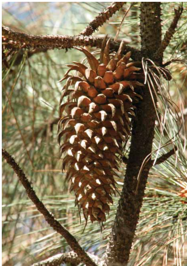
Slika 2. Coulterov bor ( Pinus coulteri ) Figure 2 Coulter pine ( Pinus coulteri )

okviru IPA projekta prekogranične suradnje Hrvatska – Mađarska (IPA CBC HU-HR 2007–2013), pod nazivom: "Nature is the first and the precious", s akronimom "Nature No. 1". Nositelj projekta bile su Hrvatske šume d.o.o., UŠP Našice, a projektom je bila obuhvaćena hortikulturna i infrastrukturna revitalizacija arboretuma Lisičine. Determinacija je rađena tijekom 2011. i 2012. godine, postupno, nakon čišćenja pojedinih dijelova.