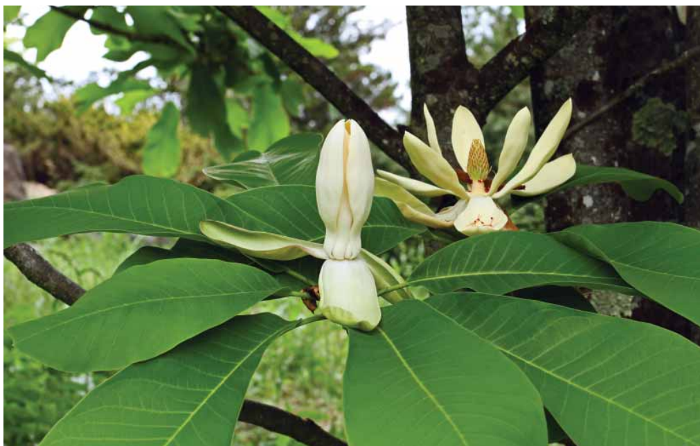
Slika 5. Japanska velelisna magnolija ( Magnolia obovata ) Figure 5 Japanese bigleaf magnolia ( Magnolia obovata )