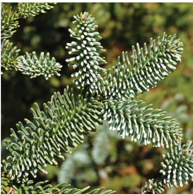
Slika 1. Plemenita jela ( Abies procera ) Figure 1 Noble fir ( Abies procera )

U ovome radu prikazane su svojte drveća i grmlja u dijelu arboretuma u kojemu se nalaze biljke s područja Europe, Azije i Sjeverne Amerike. Taj dio arboretuma bio je zarastao bagremom, kupinom i ostalim samoniklim raslinjem. Zbog toga je bio nepristupačan prije radova koji su obavljani u