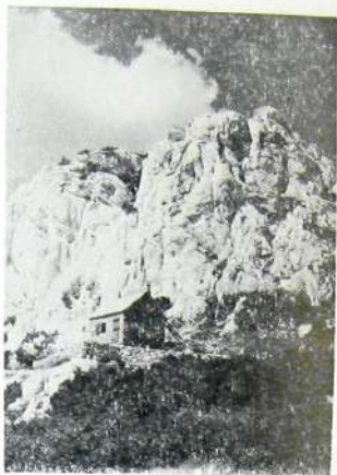
Rossijevo sklonište podno Pasarićeva kuka.

Naslovna stranica ovitka prvoga Stručnog vodiča, koji sadrži iscrpan opis prirodnih značajki Velebitskog botaničkog vrta i rezervata.