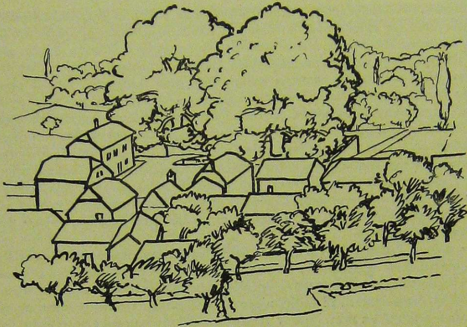
Trsteno - selo