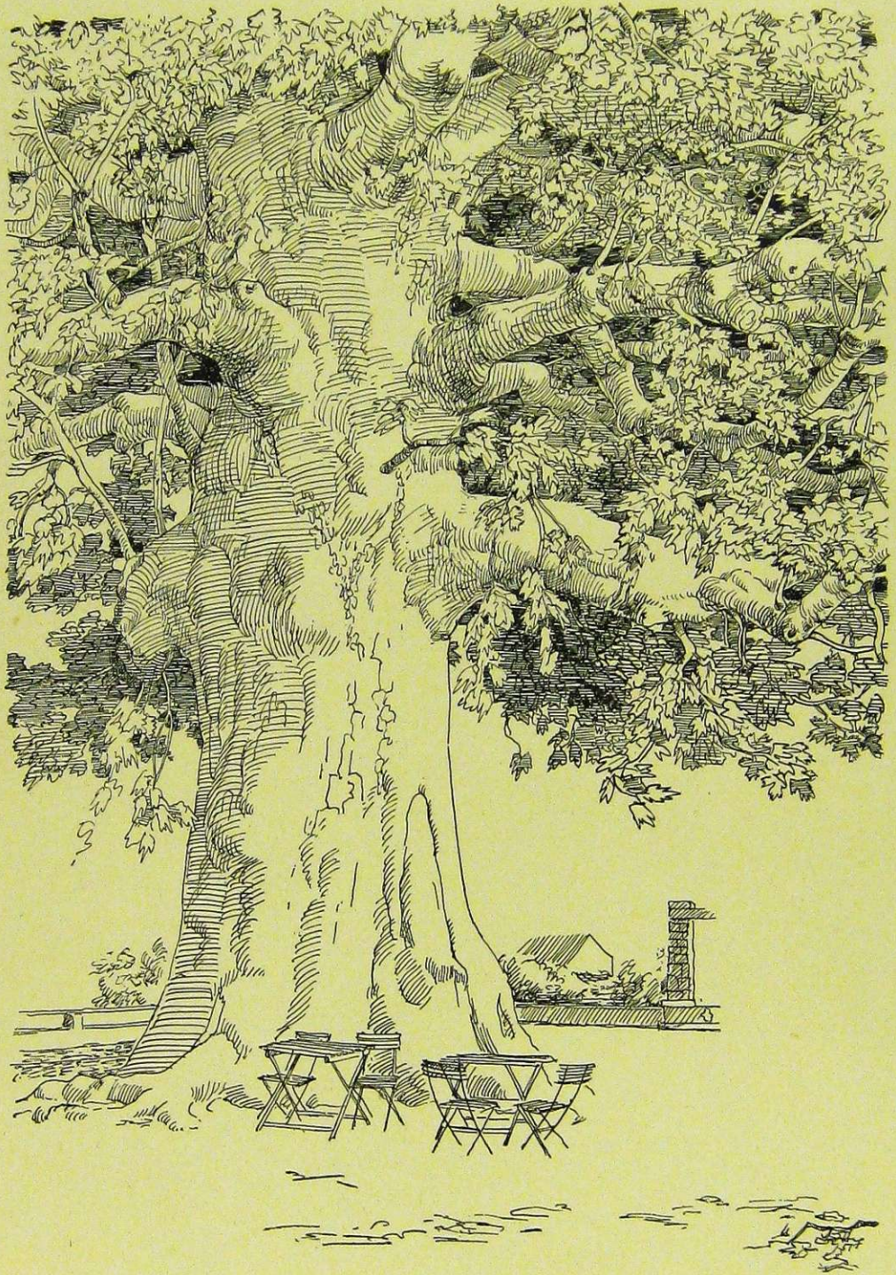
Stara platanu u selu