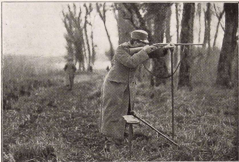
NJEG. VEL. KRALJ U LOVU NA JELENE

B elje! Malo je u nas lovaca, kojima kod spomena toga imena neće uzdrhtati srce, malo ih je, koji nebi znali, da je to jedno od najboljih i najusćuvanijih lovišta, koje obiluje visokom divljači kao tek rijetko koje u Evropi. — Kad je godine 1918. pala tudinska vlast i kad se u nekim krajevima teško stečena sloboda krivo shvatila i časovito pretvorila u anarhiju, od koje je pogotovo