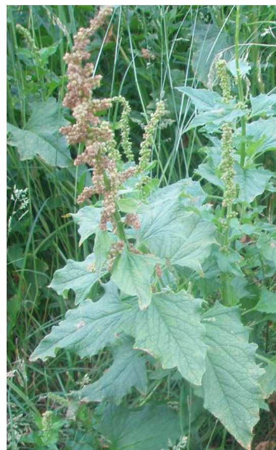
štir – Chenopodium bonus-henricus L.

Štirovača je prozvana po biljci štir, čije je ime već gotovo zaboravljeno, no ipak se može naći u rječnicima kao sinonim za dvije biljke, od kojih je jedna poznata po narodnom imenu divlji špinat, a po znanstvenom Chenopodium bonus-henricus L. Međutim poznata je i pod narodnim imenom loboda . Iz ovoga proizlazi da naziv Štirovača vuče korijen od imena biljke štir, kasnije preimenovane u lobodu, koja prema Forenbacheru predstavlja biljku 15 do 60 cm visine s bujnim rastom po humusnom tlu viših položaja Velebita, osobito oko pastirskih stanova.