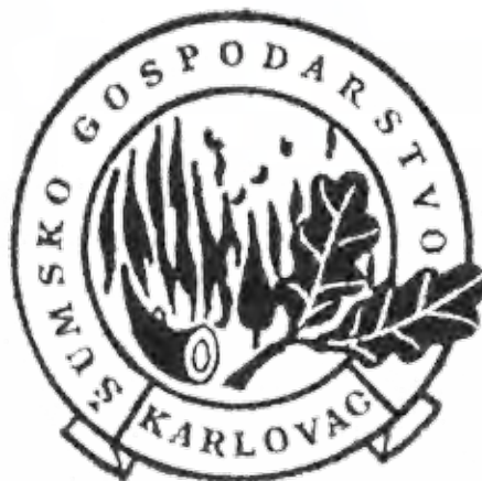
Logotip ŠG Karlovac do 1978. godine