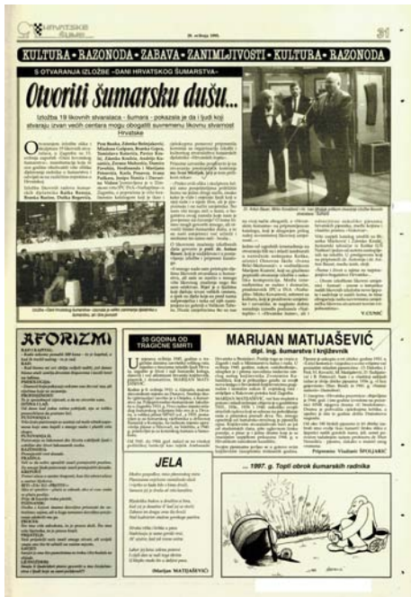
Hrvatske šume br. 47 s.31 od 29. svibnja 1995.

O likovnom značenju izložbenih djela govorio je prof. dr. Antun Bauer, koji je sudjelovao i u postavljanju izložbe i pripremi kataloga.