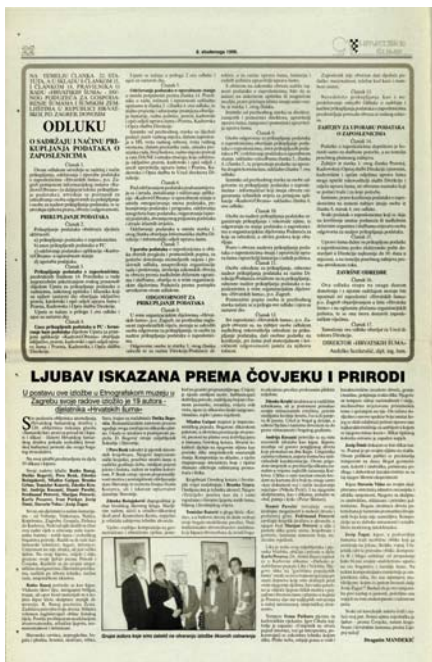
Hrvatske šume br. 62 s.22 od 8. studenoga 1996.

U postavu ove izložbe u Etnografskom muzeju u Zagrebu svoje radove izložilo je 19 autora - djelatnika »Hrvatskih šuma«