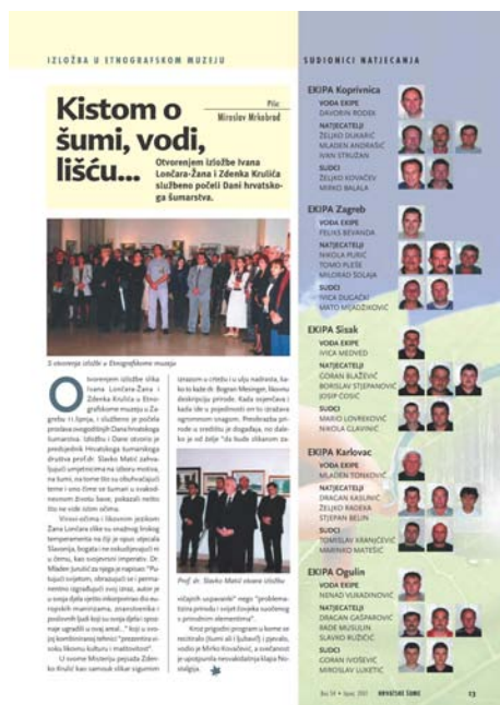
časopis Hrvatske šume br. 54 s.13 - lipanj 2001.