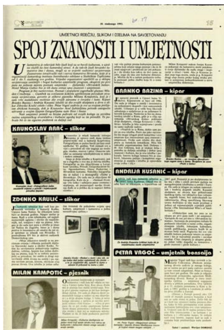
Hrvatske šume br.27 s.15 od 10. studenog 1993.