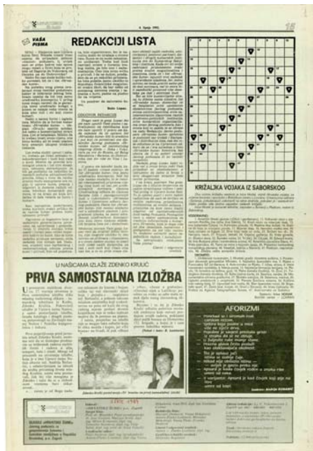
Hrvatske šume br. 2 s.15 od 4. lipnja 1992.