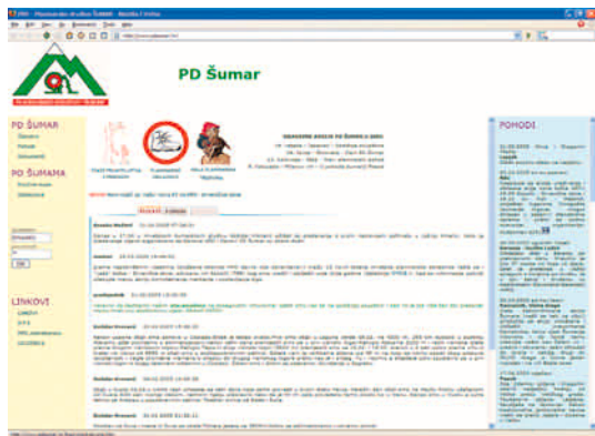
www.pdsumar.hr – stranica koja je prva ponijela nagradu IO HPS za najbolju planinarsku web-stranicu

Prvo i očito obilježje je jasno: da pripadaju planinarskom društvu, ponekad i zagriženom planinaru pojedincu, da se bave planinarstvom i možda ponekim temama bliskim planinarstvu. Iako ne bih zanemarivao one rubne i neformalne ekstreme, zadržat ću se uglavnom na službenim stranicama planinarskih društava.