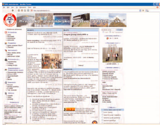
hpd.jastrebarsko.hr – najbolja planinarska web-stranica u 2003. godini

Koje bi sadržaje stranica trebala imati? To je već malo teže reći, ali pokušajmo: