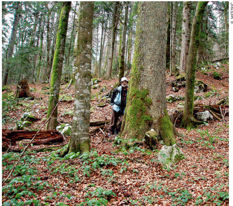
Prašuma Čorkova uvala unutar granica Nacionalnog parka Plitvička jezera

Prašuma Čorkova uvala prostire se na površini od 80 ha i predstavlja značajno šumsko područje koje obuhvaća sve stadije razvoja iskonske šume, s naglašenim optimalnim razdobljem razvoja. To znači da ćemo u sljedećim desetljećima i stoljećima pratiti njezinu prirodnu degradaciju i propadanje, da bi se ponovno vratila svojem prirodnom optimumu.