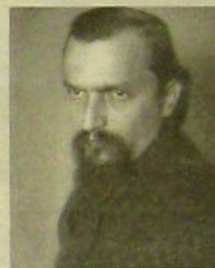
Mladi Ivan Meštrović

dobio Meštrović, a ne neki američki kipar samo potvrđuje koliki je ugled naš umjetnik uživao u SAD-u. Indijance je koncipirao kao kompoziciju od dvije odvojene skulpture, visoke šest i dugačke četiri metra, a postavljene su na visoka granitna postolja.