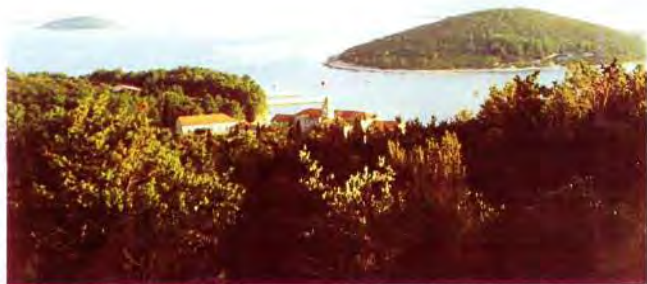
Samostan na otoku Badiji

uzgoj jelena i spremno je uložiti određena novčana sredstva, ako za uloženo dobiju određene jamčevine.