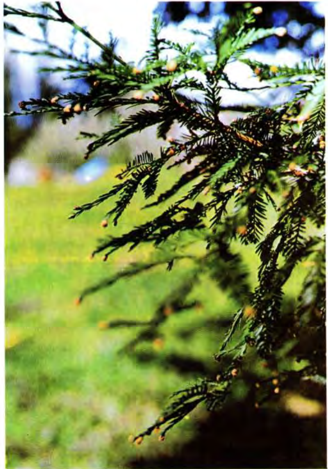
Sl. 3. Sequoia sempervirens , izbojak sa ženskim i muškim cvatovima, Paunovac 7, Zagreb.