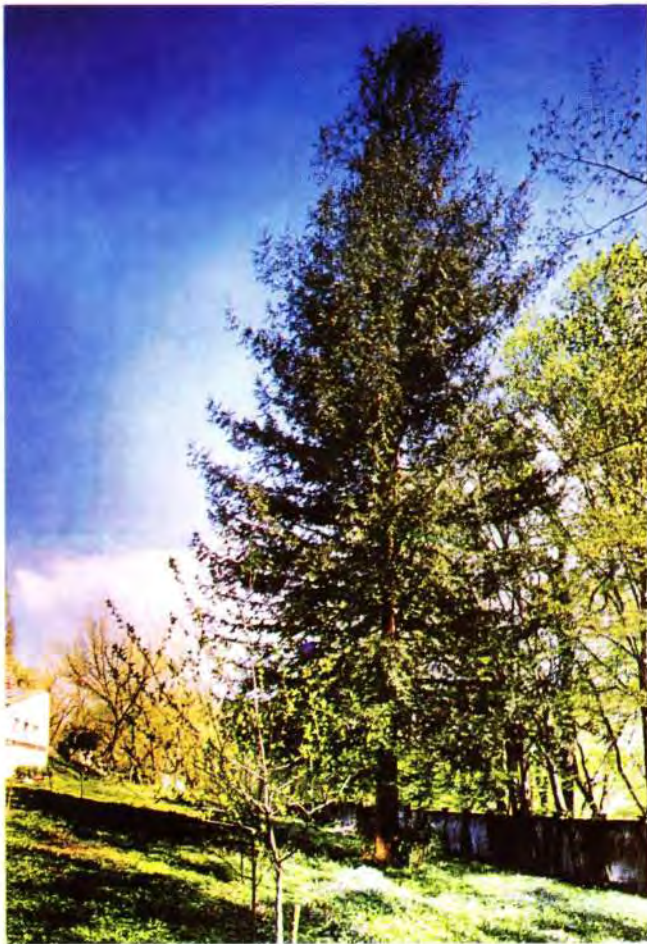
Sl. 2. Sequoia sempervirens , Paunovac 7, Zagreb.

Obalni mamutovac po fenološkim osobinama, što se tiče cvatnje, spada u rane vrste. U drugoj polovici jeseni formiraju se cvjetni pupovi za sljedeću godinu. Muški cvjetovi su gotovo kuglastog oblika ili malo produženi,