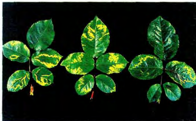
Slika 3. Listovi ruže ( Rosa canina ) sa simptomima u obliku žutih šara koje uzrokuje virus nekrotične prstenaste pjegavosti trešnje.

Prirodne šume su biocenoze naročito flornog sastava. Na taj sastav jako utječu mnogi biotički i abiotički čimbenici (patogeni, štetnici, klimatski čimbenici, tlo, industrijsko onečišćavanje okoliša). Današnje "umiranje" šuma, kako je znano, uzrokuje kompleks međusobno povezanih i promjenljivih biotičkih i abiotičkih čimbenika. Ti čimbenici djeluju kao po nekoj spirali, da bi njihov konačni učinak bio: pogubno djelovanje na šumsko drveće i grmlje. Danas se u te čimbenike, koji mogu nepovoljno utjecati na šume, ubrajaju ne samo razmjerno novootkriveni prokarioti (m i k o p l a z m e, s p i r o p l a z m e) nego i virusi i viroidi. Manion (1981) je sve čimbenike koji uzrokuju propadanje šuma podijelio u tri kategorije: predispozicijske, inicijacijske i oportunističke (koriste priliku da napadnu biljke koje su već oslabljene od prethodnih bolesti). Virusni infekcije smanjuju drveću, u odnosu na zdrave biljke, otpornost prema drugim uzročnicima bolesti (npr. Nienhaus, 1985; Hamacher i Giersiepen, 1989). U međudjelovanju s drugim abiotičkim i biotičkim agensima virusi uzrokuju za drveće pogubne stresove.