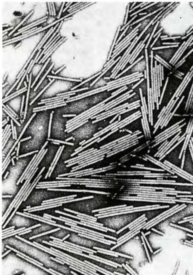
Slika 6. Elektronskomikroskopska snimka štapićastih čestica virusa mozaika duhana koji je rasprostranjen u površinskim vodama u nekim našim šumskim ekosustavima; čestice su normalno velike 300 x 18 nm ali se mogu vidjeti i kraće, slomljene čestice.

Nameće se pitanje otkud su tobamovirusi dospjeli u površinske vode? Mogući izvori virusa su biljke, i drvenaste i zeljaste, koje rastu neposredno uz vodene tokove: dokazano je da korijenje i živih biljaka može otpuštati viruse u vodu (Koenig, 1986). Tobamovirusi mogu dospjeti u vodu s česticama zemlje na koje virusne čestice mogu biti adsorbirane (Juretić i Horváth, 1991; Triolo i Materazzi, 1992). Čini se, ipak, da su najizdašniji izvor tobamovirusa u vodi raspadnuti ostaci biljnog tkiva koje potječe od inficiranih biljaka: ispiranjem tih ostataka virusi dopijevaju u površinske vode. Zanimljivo je da su u vodi najrasprostranjeniji tobamovirusi. Tome je nekoliko razloga: prvo, to su virusi koji spadaju među najraširenije viruse u prirodi i koji dolaze u inficiranim biljkama u vrlo visokim koncentracijama; drugo, to su vrlo stabilni virusi koji mjesecima mogu postojati u mrtvom biljnom tkivu a da se ne razgrade; treće, to su virusi koji se jako lako adsorbiraju na čestice pijeska i humusa s kojih se teško ispiru. Čini se da su to glavni razlozi zašto je u površinskoj vodi teže naći neke druge biljne viruse koji se ne odlikuju svim onim svojstvima kojima se odlikuju tobamovirusi. Slična svojstva imaju, na primjer, i tombusvirusi, pa su i oni dosta česti u površinskoj vodi.