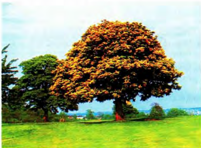
Slika 1. Stablo divljeg kestena ( Aesculus hippocastaneum ) inficirano jednim ilarvirusom; na listovima se opaža kloroza koja prelazi u opće žutilo (prema J. S. Cooperu).

va koje se nazivaju, ovisno o izgledu: kloroza, mozaik, šarenilo, prstenasta pjegavost itd. (sl. 1, 2 i 3).