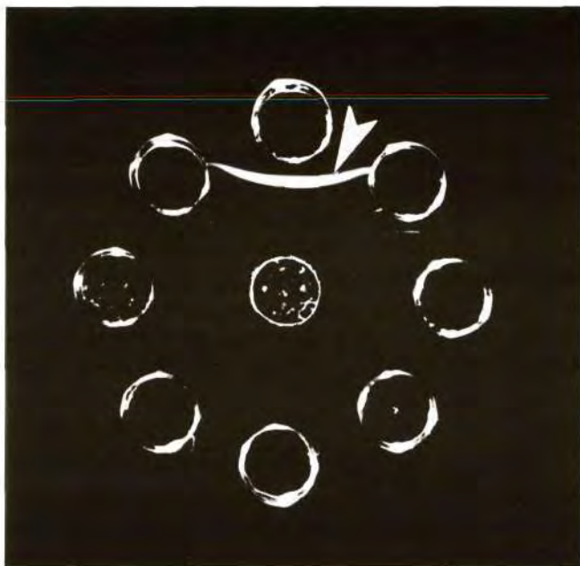
Slika 4. Prikaz serološke metode kojom se najčešće otkrivaju i identificiraju virusi u biljnom soku: agarski gel (0,7-1%) se otopi i razlije na staklenu pločicu tako da visina agara bude 1,5-2 mm; nakon prelaska u gel-stanje u agaru se načine mali zdenčići (baze) raspoređeni tako da jedan od njih ima središnji položaj, a više njih kružan periferni položaj. U središnji zdenčić stavlja se specifični virusni imuni serum (antiserum), a u okolne zdenčiće uzorci biljnog soka koji se testiraju na virus: kroz gel difundiraju i virusne čestice i antitijela (koja se nalaze u serumu), tako da će se na određenom mjestu oni susresti i reagirati. Reakcija između virusa i seruma vidi se kao bijela (precipitacijska) linija (strelica); takve će linije nastati samo kod onog perifernog zdenčića čiji uzorak sadrži virus; na prikazanoj slici samo je jedan uzorak sadržavao virus (strelica).