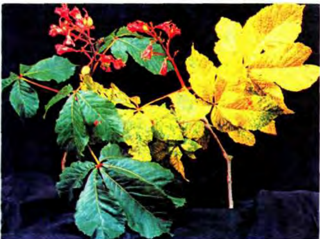
Slika 2. Divlji kestena ( Aesculus carnea ): lijevo - zdrava grana; desno - grana inficirana jednim ilarvirusom; vide se simptomi u obliku žutog mozaika koji se pretapa u opće žutilo listova (prema J. S. Cooperu).

Virusi nađeni u tim biljkama pripadaju vrlo različitim virusnim skupinama. Tako su nađeni virusi iz skupina tobamovirusi , tombusvirusi i poteksvirusi koji se u prirodi šire mehaničkim putem (kontaktom) a ne živim prenositeljima (vektorima). Osim njih u drvenastim biljkama nađeni su i virusi koji se prenose vektorima; takvi su npr. virusi iz skupine potivirusi (prenose se lisnim ušima), zatim virusi iz skupine nekrovirusi (prenose se gljivicama koje žive u tlu) te virusi iz skupina nepovirusi i tobravirusi (prenose se nematodama). Koliko pojedina šumska drvenasta biljna vrsta može biti podložna različitim virusnim infekcijama, poučan je podatak Wintera (1987), koji je samo iz vrste Fagus sylvatica izolirao veći broj virusa koji pripadaju četirima virusnim skupinama ( poteksvirusi , potivirusi , bromovirusi , nepovirusi ).