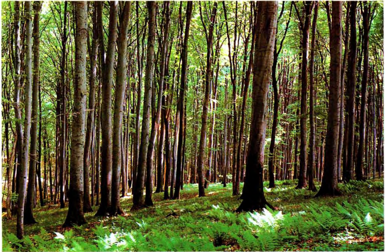
Bukova šuma na Bilogori

The management of stands is even-aged, and the aim of management, in this most representative working class of beech rotation in 100 years, is achieving the most optimal ratio of species mixture at the end of rotation.