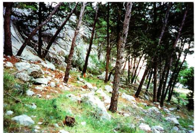
Slika 2. Borova šuma na podlozi gariga