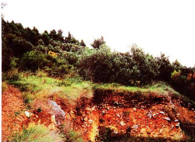
Slika 1. Pogled na presjek zapuštenog poljoprivrednog tla i njegovu fitocenozu.

U zadnje vrijeme fitocenolozi posebno izdvajaju borove šume s obzirom na njihovu dominantnu pojavu u prirodi, iako one u biti pripadaju ili svezi crnikovih šuma ili svezi gariga, što opet ovisi o plodnosti tla na kojima se one pojavljuju. Ukoliko se razvijaju na jačim tlima, prisutnije su vrste koje karakteriziraju šume crnike, a ukoliko se razvijaju na nerazvijenim tlima, prisutniji su elementi gariga. Za nas je to posebno značajna činjenica u protupožarnom smislu, jer se te vrste borovih šuma razlikuju po obrastu i strukturi. Za elemente makije u podstojnoj etaži borova ima dovoljno svjetla, dok to nije slučaj za karakteristične elemente gariga. U ovom slučaju kada svjetlost postaje limitirajuć čimbenik, u borovim šumama na podlozi gariga u potpunosti izostaje prizemno rašće, što u protupožarnom