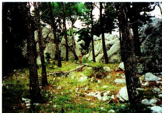
Slika 4. Borova šuma na podlozi kretskog bušina

Promjenom gospodarskih prilika, lokalno pučanstvo napušta poljoprivredne površine i okreće se profitabilnijoj gospodarskoj grani. Pasivnost čovjeka koriste borove šume koje zauzimaju bogata poljoprivredna tla, ali zauzimaju i nerazvijena tla koja su se koristila za pašnjake. Stoga borove sastojine u praktičnom smislu mo-