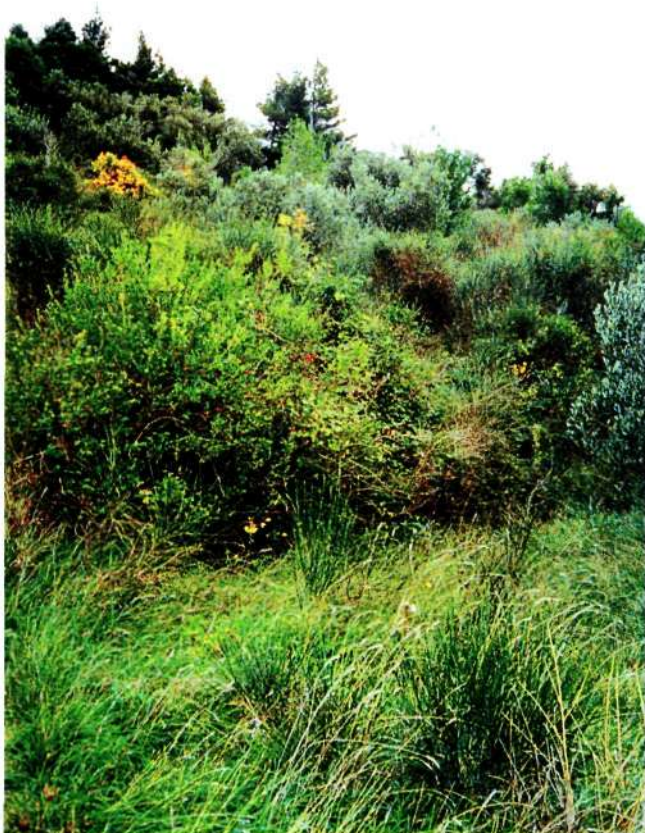
Slika 3. Nastanak borove šume na napuštenom poljoprivrednom tlu

smislu itekako olakšava cjelokupnu situaciju. S druge strane borove šume na podlozi makije sa svojom fitocenološkom slikom predstavljaju opasnost za nastanak i brzo prenošenje požara. Ovdje priroda brzo reagira na utjecaj čovjeka koji se ogleda u njegovoj pasivnosti prema napuštenim antropogeniziranim tlima.