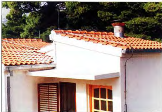
Slika 5. Eksperimentalni laboratorij izgrađen 1994. u Makarskoj (Osejava), s dijelom instrumentarija za istraživanje zapaljivosti i gorivosti živih i mrtvih šumskih goriva, stoji godinama prazan i neiskorišten.