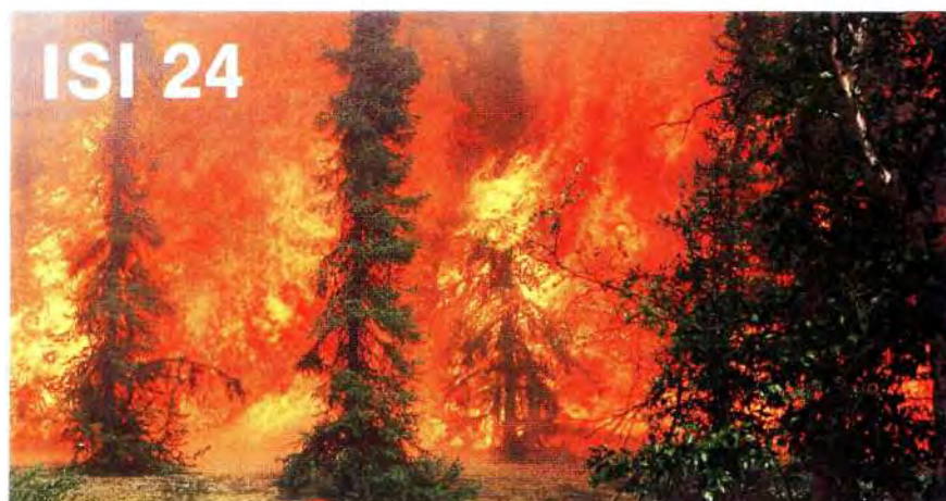
Experimental Fire: L5 Date: July 7