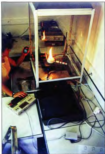
Slika 4. Laboratorijsko testiranje zapaljivosti i gorivosti drvolikog vrijesa ( Erica arborea ) u eksperimentalnoj postaji INRA-e u Ruscasu (Francuska).

"Trebalo nastaviti sa studijom ponašanja požara u makarskom području koja treba sadržavati procjenu i modifikaciju drugih sredozemnih modela širenja požara. Osim što su te informacije važne za planiranje predsužbijanja, znanje stečeno ovom studijom može biti od neprocjenjive vrijednosti kao nastavno sredstvo za obuku operativnih rukovoditelja suzbijanja".