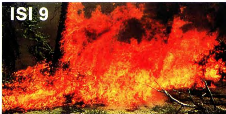
Experimental Fire: L4 Date: July 6

Za uspješno suzbijanje tih požara potpuno su različite potrebe u ljudstvu i materijalno-tehničkim sredstvima.