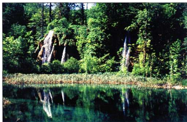
Slika 5. Galovački buk

SUMMARY: The author gives a detailed explanation of the beginning and course of ageing of the Plitvice Lakes, a gem of protected nature in the category of national parks. This area has been listed into the world natural heritage, run by the UNESCO in Paris.