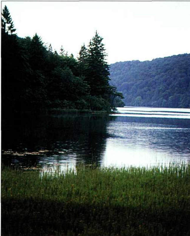
Slika 1. Matica i Proščansko jezero