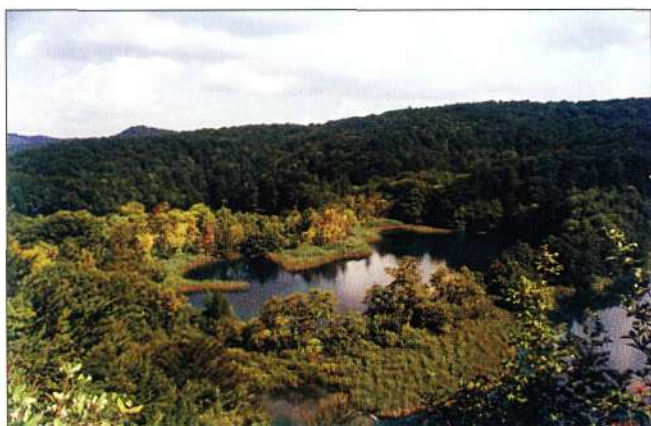
Slika 4. Okrugljak