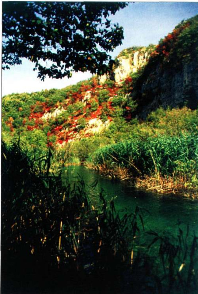
Slika 2. Kanjon Korane

širokom prostoru izvorišne zone Plitvičkih jezera uočava naglašena i brza prirodna obnova šuma.