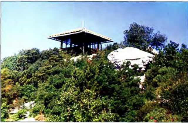
Montokuc, prom. kućica