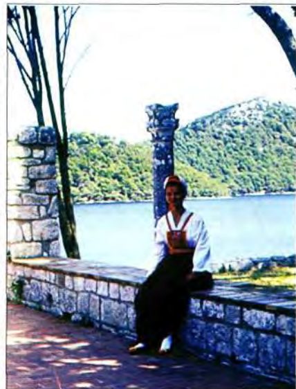
Djevojka u nošnji

Ruho otoka Mljeta krije u sebi spoj crvene i bijele boje. Vuna suknja – gunj intenzivne je crvene boje, izvorni dio mljetske nošnje nastao vjerojatno od dinarske raše, koja se prvo nosila kao haljina preko glave. Suknja ima prsni i ledni dio koji se povezuju trakama preko ramena. Na gornji dio oblači se košulja bijele