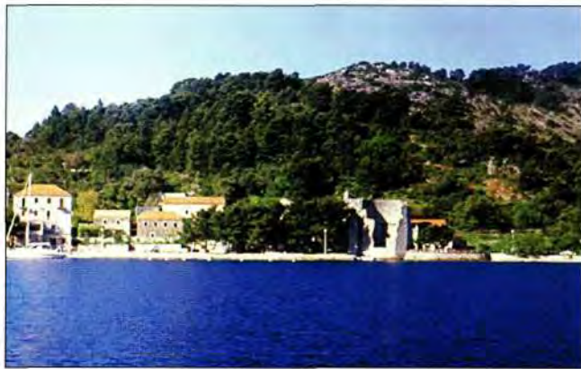
Polače, palača i naselje

zilika i još jedne građevine nepoznatog titulara. 27 Palača je vjerojatno iz 4. ili 5. stoljeća po Dyggve-u, danskom istraživaču. 28 Imala je dvije kule u pročelju, s ulaznim vratima okrenutim moru, dva prostora za stražara. Imala je također veliku središnju dvoranu raspona