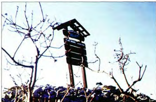
Veliki Sladin Gradac, edukativni pano

Ilirske građine u vrijednosti svojeg položaja kriju obično nesvakidašnji pogled na bližu i dalju okolicu. Smještene su na uzvišenjima s kojih se može kontrolirati prilaz uzvišenju, a isto tako i efikasna obrana. 19