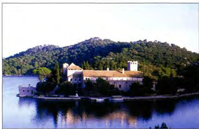
Sv. Marija otočić, samostan

U ovom samostanu bilo je sjedište Mljetske kongregacije ( Congregatio Melitensem ili Melitanam ), od njezina osnutka početkom 16. st. Prvi predsjednik bio je opat i pjesnik Mavro Vetranović Čavčić, koji je iz Rima pozvan kako bi stao na čelo Kongregacije i oživio njezine samostane. 18 U sastavu Kongregacije bila su četiri muška samostana na području Dubrovačke Republike (Sv. Mihovil na Šipanu, Sv. Andrija na morskoj pučini, Sv. Jakov kod Dubrovnika i Sv. Marija na Mljetu). Ovim se htjelo postići da samostani budu izravno pod Rimom, tj. da se izbjegne utjecaj Venecije na Dubrovačku Republiku. Sjedište Kongregacije preneseno je kasnije u Sv. Jakov kod Dubrovnika. Jedan od opata bio je pjesnik Ignjat Đurđević iz poznate dubrovačke patricijske obitelji. Spjevao je satirički ep "Suze Marunkove", u kojemu se spominju geografski pojmovi Mljeta, po čemu se vidi da su likovi vezani uz otok. 24 Kongregacija je definitivno dokinuta 1808. zauzimanjem Dubrovnika od Napoleonove vojske. Ukinućem Kongregacije raznesena je i spaljena njezina velika knjižnica i pismohrana, tako da su neki podaci nedostupni. 25 Samo mali dio sačuvan je u knjižnici Male Braće u Dubrovniku. 26 Benediktinci su umirovljeni i preseljeni u samostan Male Braće u Dubrovniku, a zgrada otada mijenja vlasnike. Mljetski statut odnesen je u Beč, a u zgradi samostana obitavala je Austrijska šumska uprava do kraja I svj. ra-