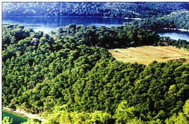
Pogled s Velikog Sladina Gradca