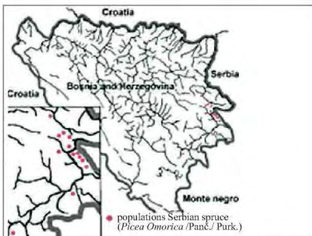
Slika 1. Rasprostriranje pančičeve omorike u Bosni i Hercegovini Figure 1 Distribution of Serbian Spruce in Bosnia and Herzegovina

Velike klimatske promjene, posebno globalno zatopljenje, kao i mnoge promjene koje su nastale antropo-