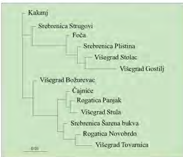
Slika 3. Dendrogram 1 baziran je na genetičkim rastojanjima prema Neiu (1978)

Figure 3 Dendrogram 1 is based upon genetic distance as determined by Nei (1978)