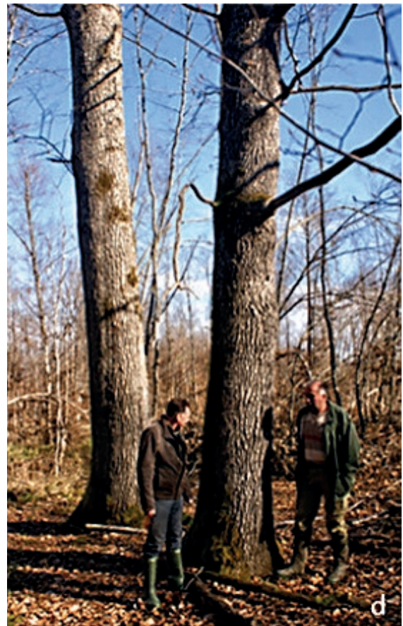
Slika 1. Šume hrasta lužnjaka (E.3.1.1.) u dinarskom području Hrvatske: Premužno jezero kod Otočca prije i za vrijeme poplave (a,b); Hrastov lug kod Drežnice (c) i Nova Kršlja kod Rakovice (d).

Figure 1. Pedunculate oak forests (E.3.1.1.) in the Dinaric area of Croatia: Premužno jezero near Otočac, before and during the floods in year 2015 (a, b); Hrastov lug at Drežnica after flood (c), and Nova Kršlja near Rakovica (d).